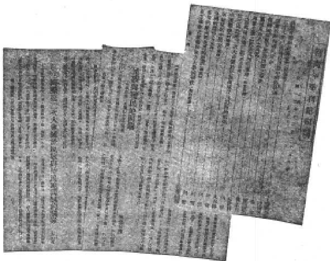
1924年12月20日《新青年》季刊第4号所载 列宁《民族和殖民地问题提纲初稿》和 《民族和殖民地问题委员会的报告》的中译文