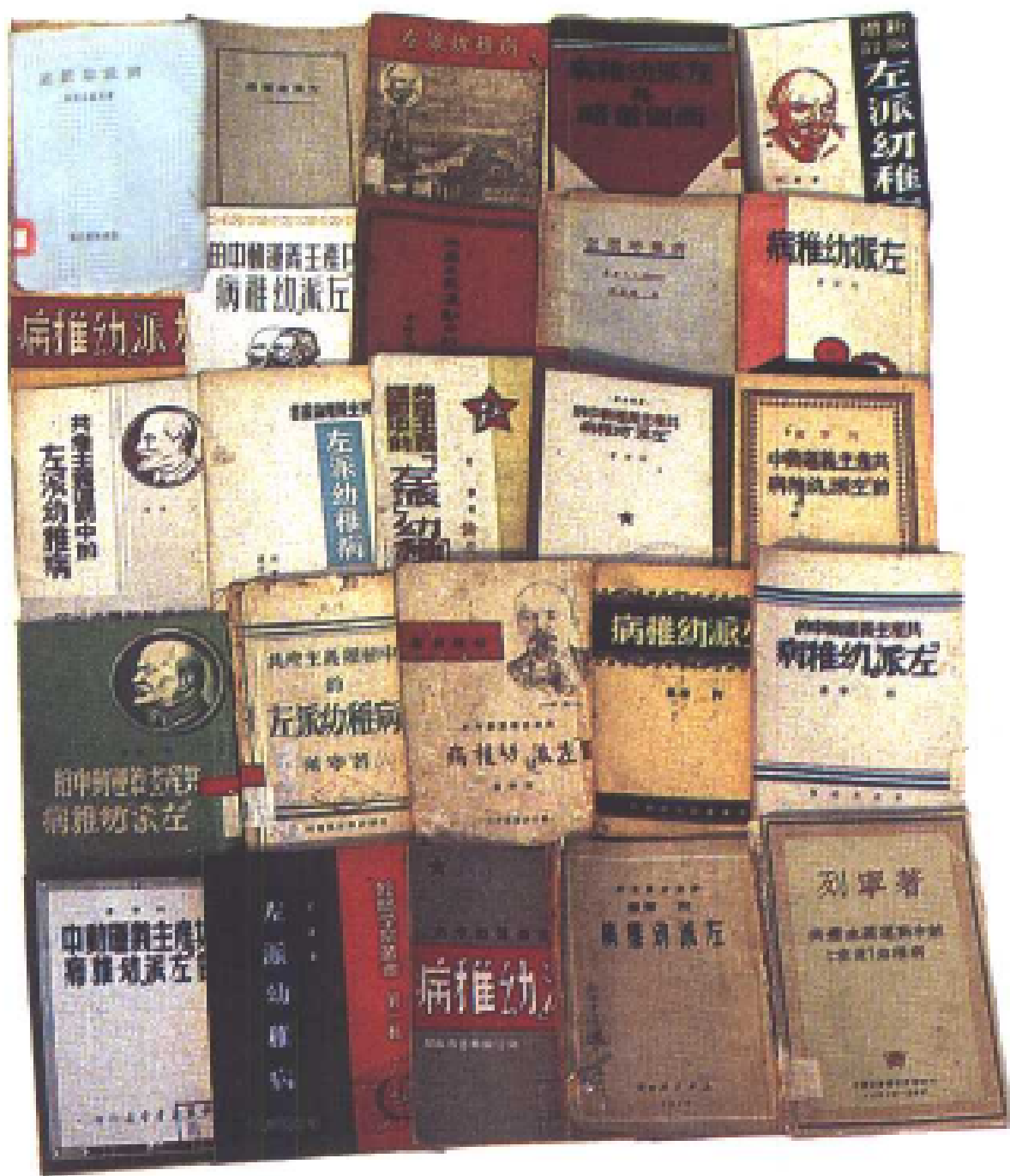
1927—1949年我国出版的 列宁《共产主义运动中的“左派”幼稚病》一书的部分版本